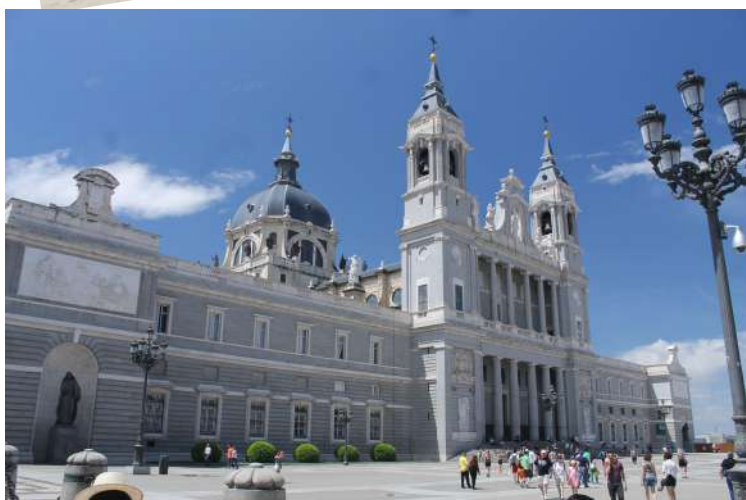
Catedral de la Almudena