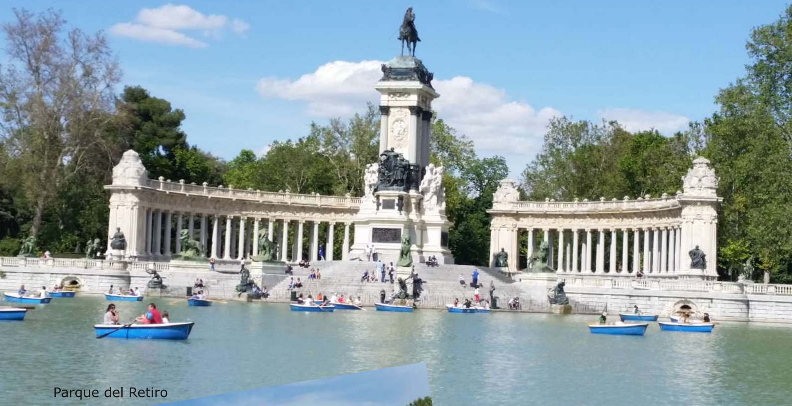
Parque del Retiro