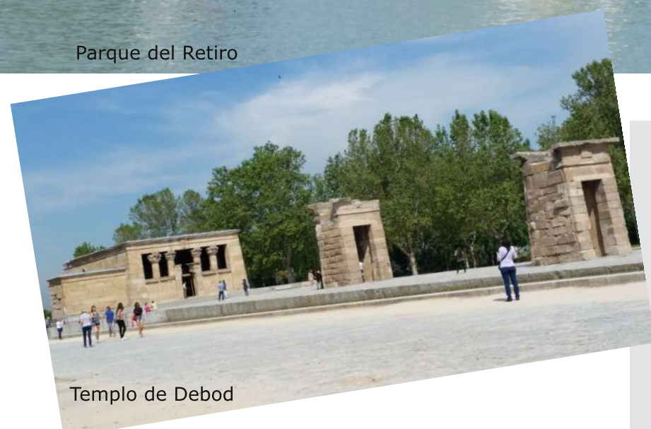
Templo de Debod