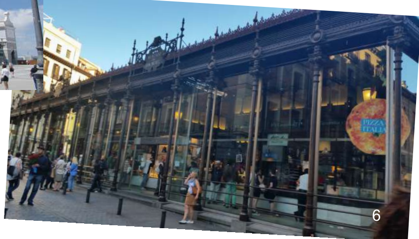
Mercado San Miguel